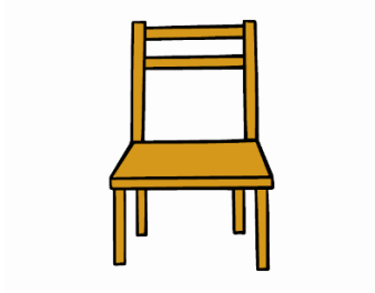
Chaise (hors tissus et paille)