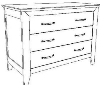
Commode simple 3 tiroirs