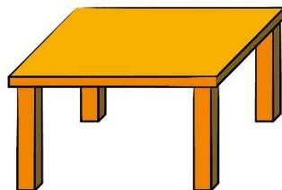
Table SIMPLE (6 personnes)