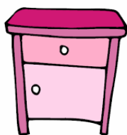
Chevet ou petit meuble 1 porte