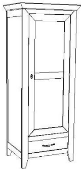
Bonnetière ou petite armoire 1 porte :